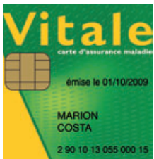
Sécurité Sociale étudiante