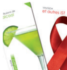
Prévention et Santé