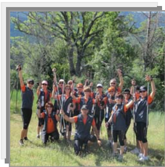
Sortie avec Ass. Nordic Walking