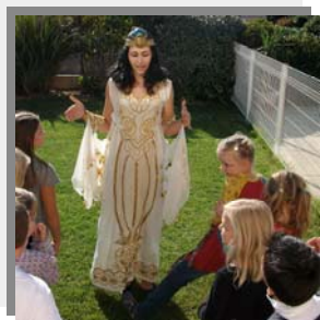
Animation anniversaire Ass. SILIA