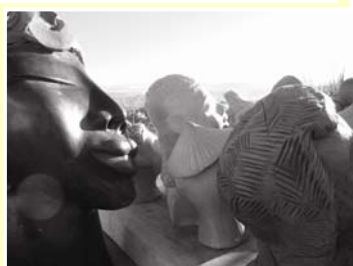
Atelier Modelage Ass. Le bec de l'art