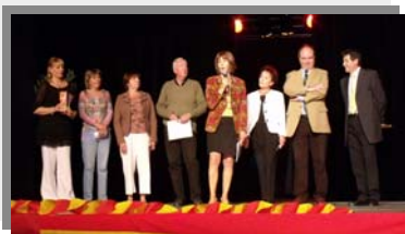
Ass. Carriéro Drécho