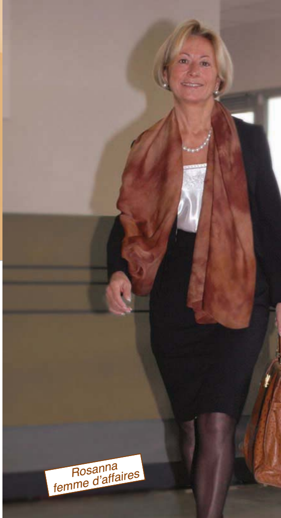
Rosanna femme d'affaires