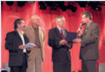
La municipalité a tenu à rendre un hommage à Jean Boiteux lors d'une cérémonie des Trophées sportifs

Disparu accidentellement le 11 avril dernier, Jean Boiteux a marqué la natation française en décrochant l'Or aux Jeux olympiques d'Helsinki en 1952. C'est à La Ciotat qu'était née sa vocation. Son frère témoigne.