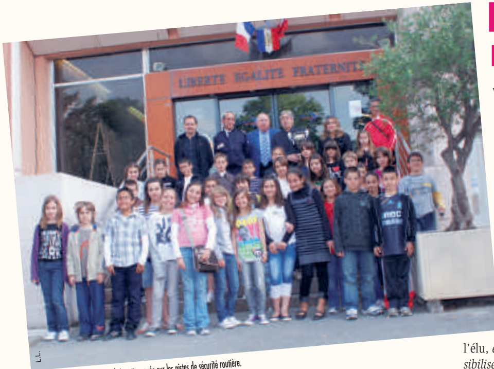
Près de 400 écoliers ont été évalués cette année sur les pistes de sécurité routière.