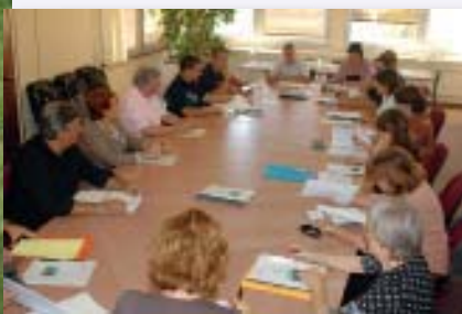
Le CCAS s'appuie sur un réseau de partenaires publics, privés et associatifs afin d'assurer sa mission d'accueil, d'écoute et d'aide sociale