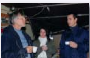
Maraudes dans le cadre du «Plan de veille hivernale»