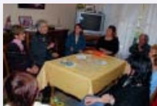
Les séances de lectures à domicile font partie du dispositif déployé pour lutter contre l'isolement des seniors dans certains quartiers de la ville

L'action de Noël est un autre dispositif dont l'objectif est de rompre l'isolement et d'apporter aux personnes isolées du réconfort et un lien social au moment des fêtes de fin d'année. Cette action repose sur la distribution, au domicile des bénéficiaires, des repas ou colis «spécial Noël». Plus qu'une simple distribution ou livraison de nourriture festive, il s'agit d'un véritable moment privilégié d'échanges et de dialogue avec des personnes isolées, souffrant d'une absence de lien social et de compagnie.