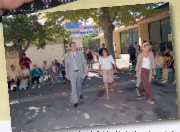
Le maire de La Ciotat assiste régulièrement aux animations proposées par le CCAS