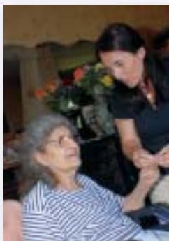
Les soins infirmiers et le portage de repas font partie des services proposés par le pôle Aide et soutien à la vie à domicile du CCAS