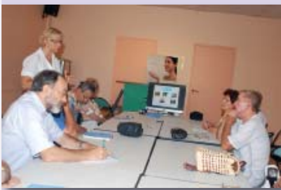
Des ateliers axés sur l'audition et la mémoire ont été proposés aux bénéficiaires du CCAS