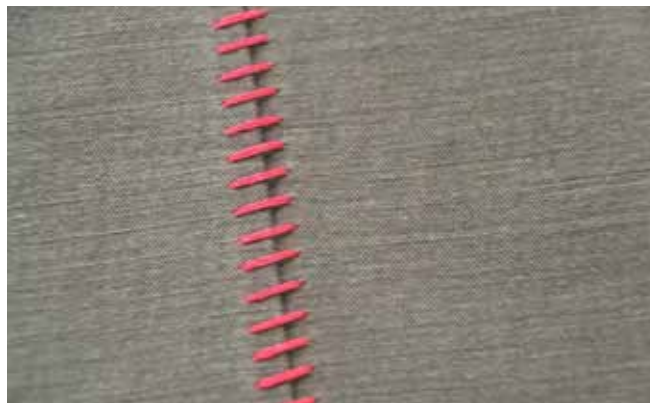
Vue des points de l'envers

Assembler et coudre également les éléments de coupe 1 et 2 avec la couture plate (attention, l'élément 2 est posé sur l'élément 1) pour que la couture de division repose en dessous. Le devant et le dos sont identiques.